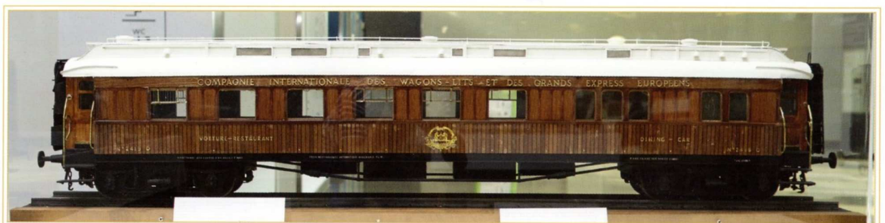
Maquette d'une voiture restaurant en Teck de la Compagnie des Wagons-lits datant de 1880 Crédit photo : D.R..