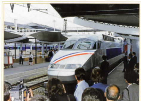
La rame TGV Atlantique inaugurale, décorée d'un simple ruban tricolore, arrive en gare de Le Mans à l'occasion de l'inauguration de la ligne à grande vitesse du TGV-Atlantique par le Premier Ministre Michel Rocard le 20 septembre 1989.