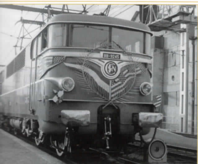
Le même train présidentiel est remorqué d'Avignon à Paris-Lyon par la BB 9245 également pavoisée.