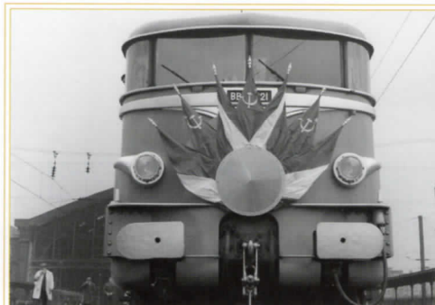
Au départ de Lille, la locomotive BB 16021 pavoisée remorqué le train spécial à destination de Corbie transportant Nikita Khrouchtchev président du conseil des ministres d'URSS lors d'un voyage officiel le 3 avril 1960.