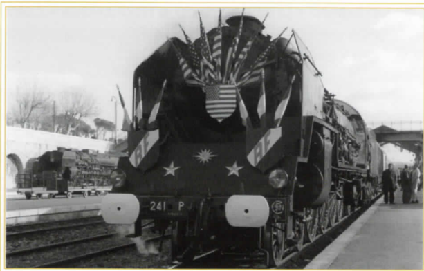
Visite en France du Président des Etats-Unis Dwight David Eisenhower. Le train présidentiel est remorqué de Toulon à Avignon par la locomotive 241P 14 pavoisée aux couleurs des Etats-Unis et de la France), le 23 décembre 1959.